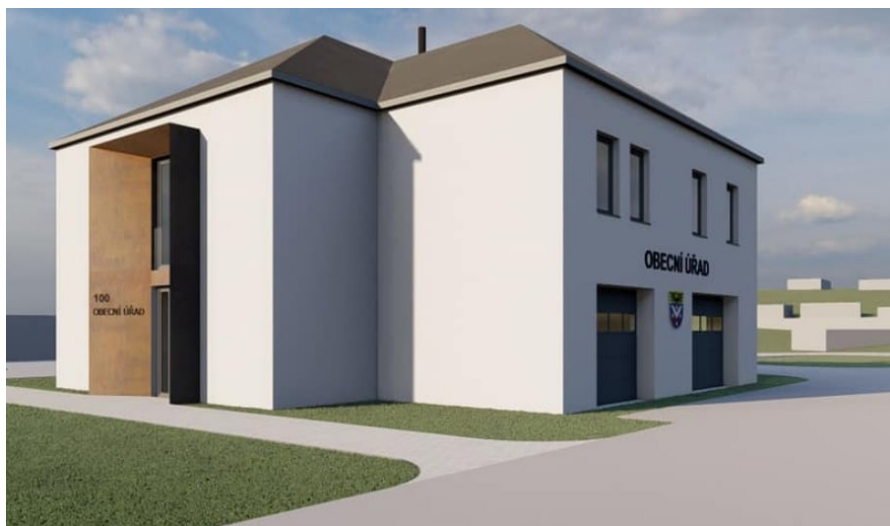
Obecní úřad se na podzim začne rekonstruovat. Takto bude vypadat na konci srpna 2022. Více na straně 1 a 2.