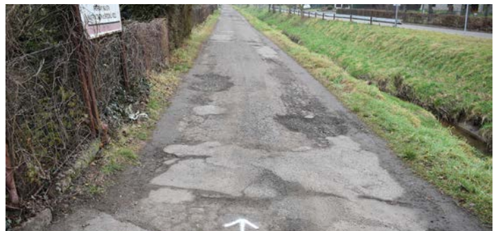
Opravou projde i úsek podél potoku Racková.