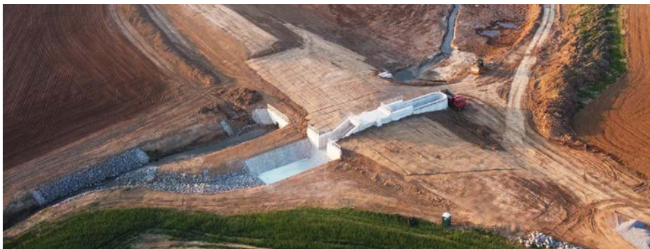
Snímek stavby nového poldru pořízený z dronu.

„Retenční nádrž leží cca 550 metrů východně od zástavby rodinných domů. Má celkovou plochu 0,85 hektarů a dá se k ní dostat po dvou polních cestách. Stavba jako celek řeší protipovodňovou ochranu, respektive zmenšuje riziko záplav zastavě-