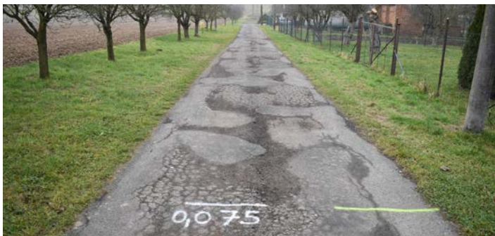
Cestu U Běloví je plná výtluků.

Celková výměra opravovaného úseku činí 1951 m 2 . Dotace se vztahuje na většinu plochy, až na 55 m 2 , které jsou neuznatelnými náklady. Je tomu tak proto, že se jedná o plochu, kterou vlastní soukromí majitelé. Obec má jejich souhlas k realizaci stavby, avšak nemůže si ji zahrnout do dotace. Neuznatelné náklady tak činí cca 100 000 Kč a Lehotice je zaplatí ze svého rozpočtu. Celková výše spoluúčasti obce Lehotice na obnově povrchů komunikací je 813 000 Kč.