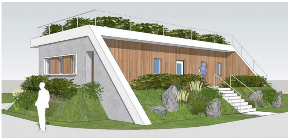
Vizualizace objektu budoucí čističky odpadních vod.

„Častý mýtus, který se okolo dotací šíří je, že „dotace“ znamená, že dostaneme finanční prostředky například na celou čističku či další investice. Právě naopak, musíme se na nich sami finančně spolupodílet. Do budoucna bude stoupat finanční podíl obcí, era, kdy jsme dostali dotace ve výši 80 – 90 % pomalu končí,“ vysvětlil na závěr starosta.